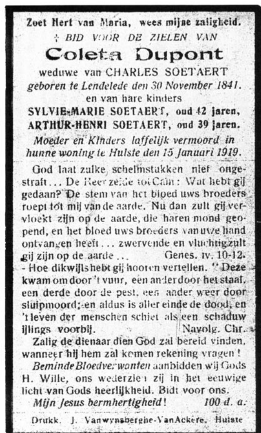
Bidprentje van de slachtoffers van de drievoudige moord op 15 januari 1919.

In De Leiewacht van 18 april 1925 (dus meer dan 5 jaar na de feiten) vinden we een artikel over de moord: